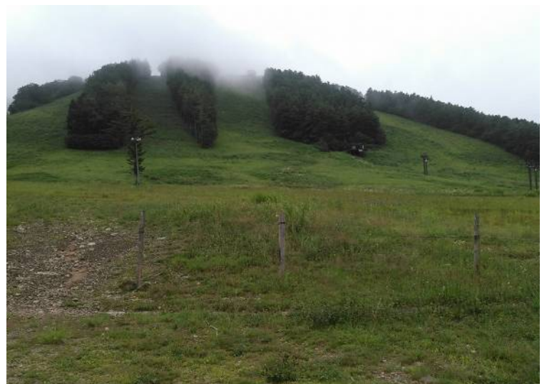
学生の頃、家族や友人たちと頻りに行った戸隠スキー場